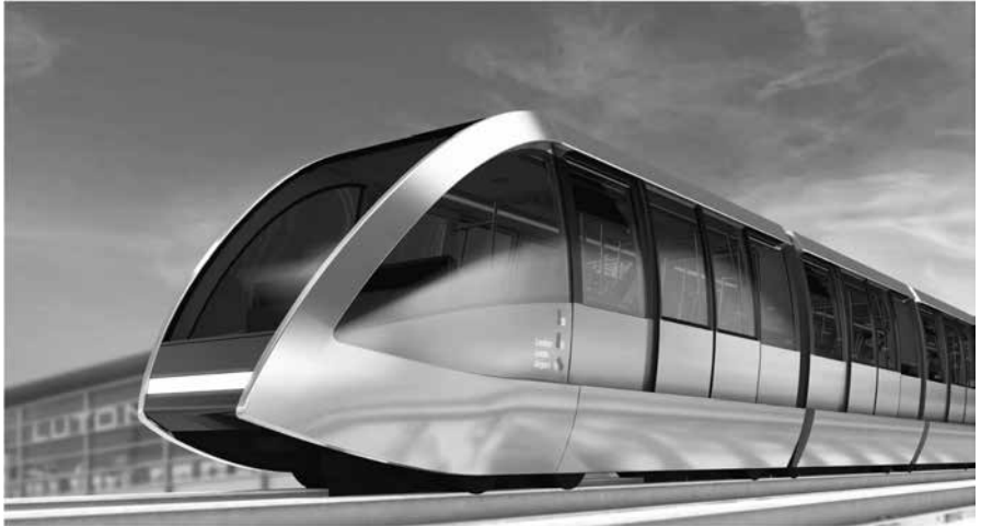
Abbildung 11: Flughafenterminal → Bahnstation