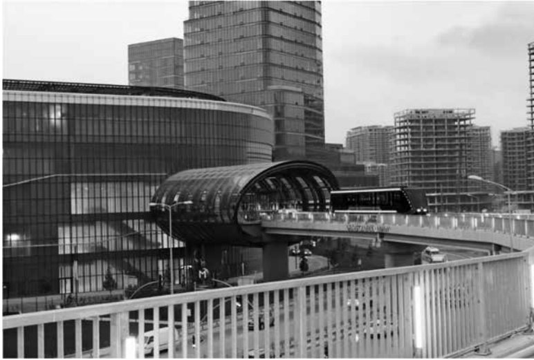
Abbildung 7: People Mover in Istanbul