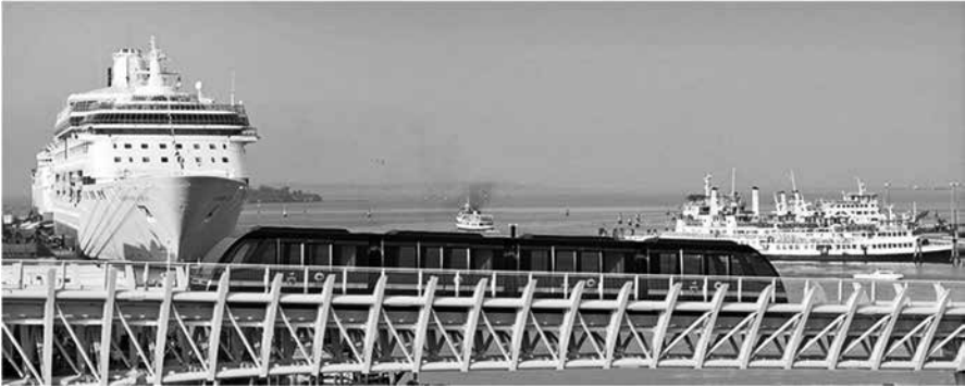
Abbildung 10: Venedigs Cable Liner