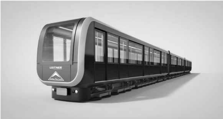
Abbildung 6: Luftkissen-Seilbahn in Serfaus-Fiss-Ladis

auf den neusten Stand gebracht und mit modernen dreiteiligen, durchgängigen Wagenzügen ausgestattet. Die neueste Generation der Luftkissentechologie erlaubt die Verbindung von hoher Geschwindigkeit (11 m/s oder 40 km/h), lautlosem Transport und sehr niedrigen Emissionswerten. Die Stationen werden mit Bahnsteigverglasungen und –türen sowie Zugangskontrolleinrichtungen ergänzt. Die Beförderungskapazität steigt von 2'000 auf 3'000 Fahrgäste pro Stunde und Richtung.