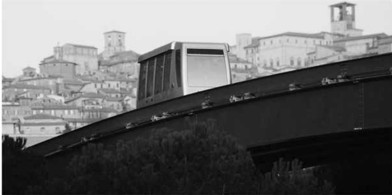
Abbildung 9: MiniMetro Perugia

Die Fahrzeuge können abhängig von der jeweils erforderlichen Kapazität eingesetzt werden. Der Mindestabstand der Fahrzeuge liegt bei einer Minute, im Normalbetrieb etwa bei 2½ Minuten.