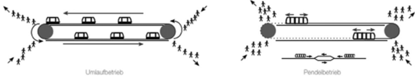
Abbildung 4: Umlauf- und Pendelbetrieb