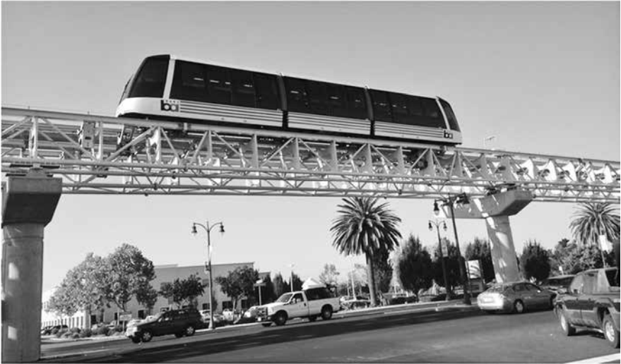
Abbildung 1: Oakland Airport Connector