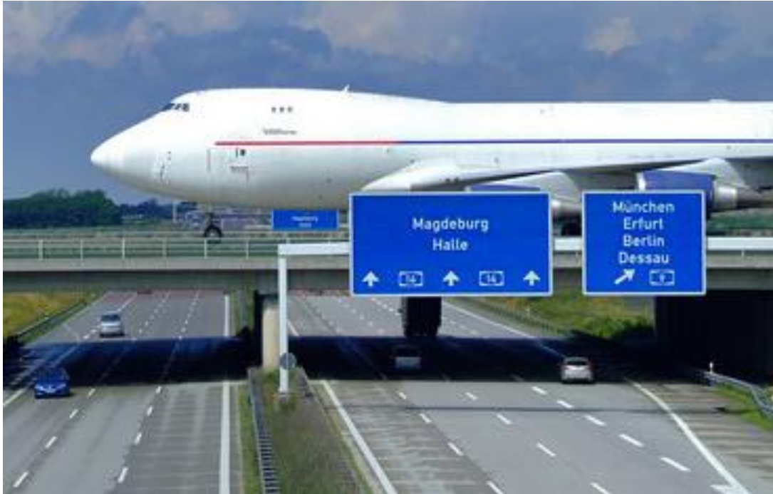
Cargo-Drehscheibe Leipzig-Halle. Hier verkehren 50 Cargo-Airlines.