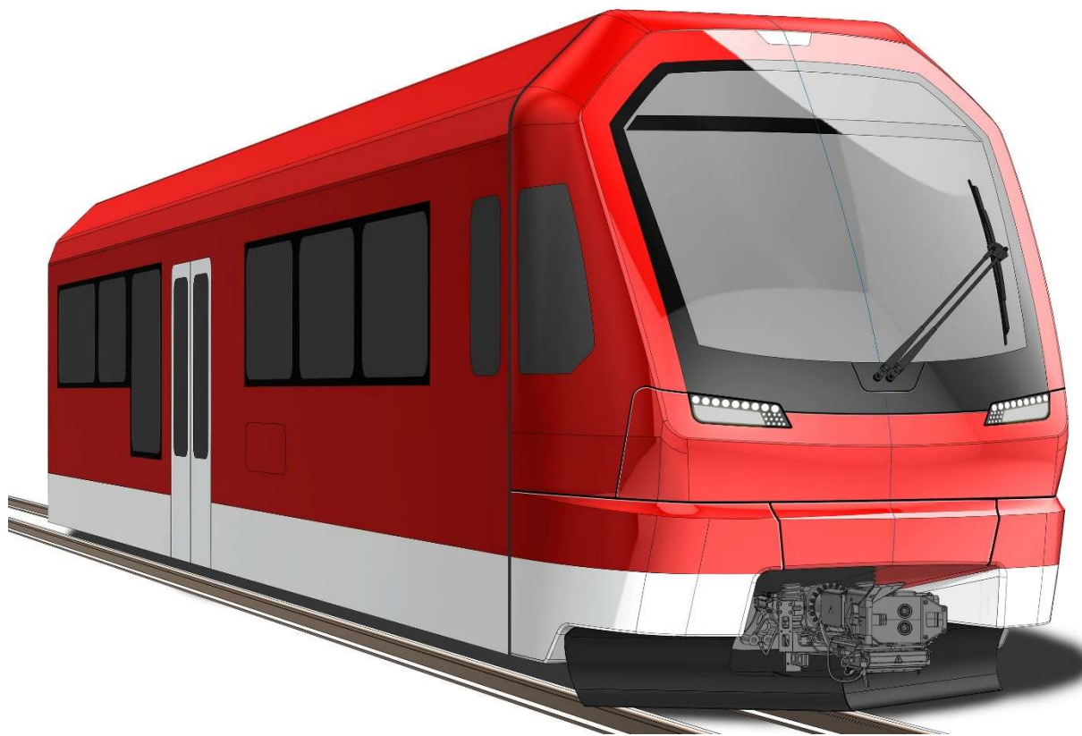
Entwurf des Steuerwagens des Pendelzugs Typ ORION für die Matterhorn Gotthard Bahn

Mittagessen auf Einladung der Stadler Rail Group