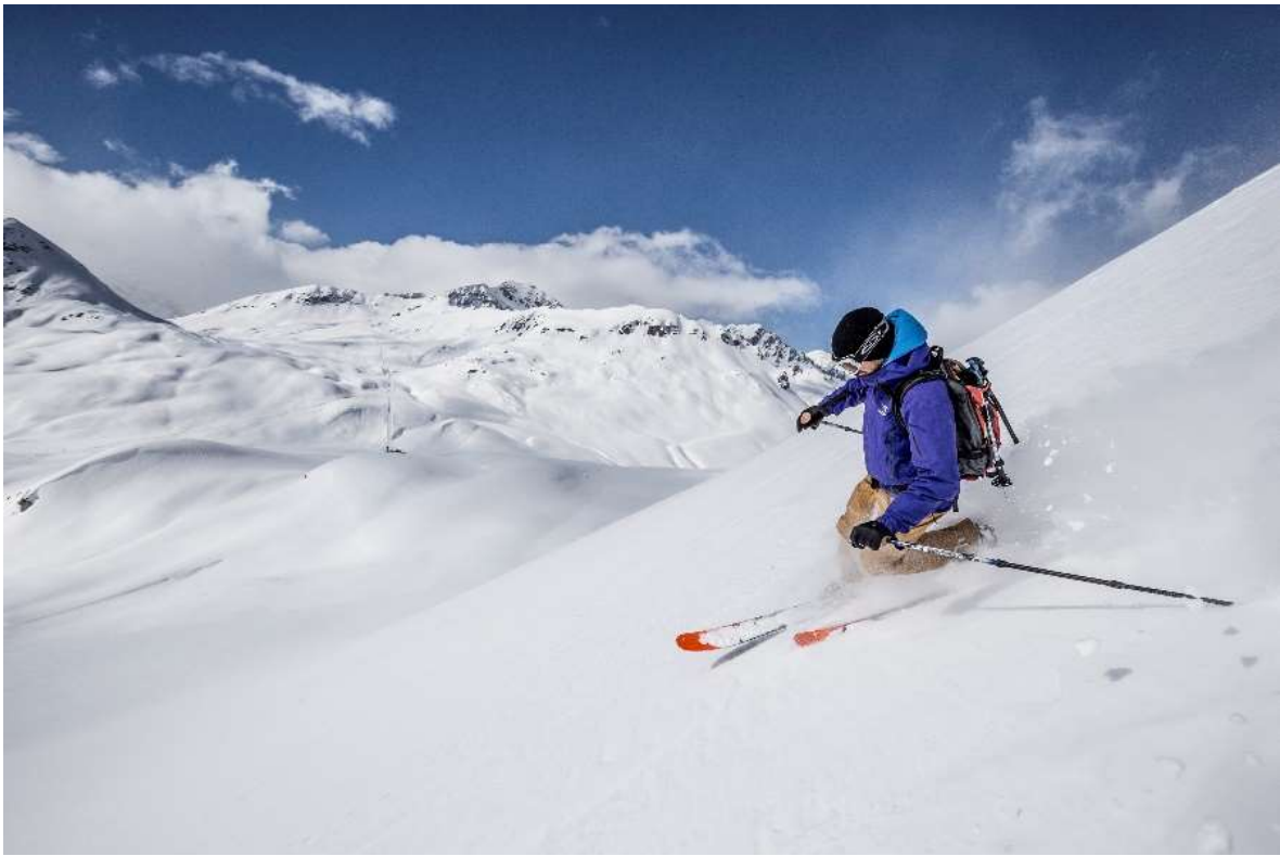
Noch profitieren die Skihochtourenfahrer von den hervorragenden Verhältnissen. Im Hintergrund der Skilift Vallatscha (2'700 MüM.) im Wintersportgebiet Minschuns im Val Müstair.