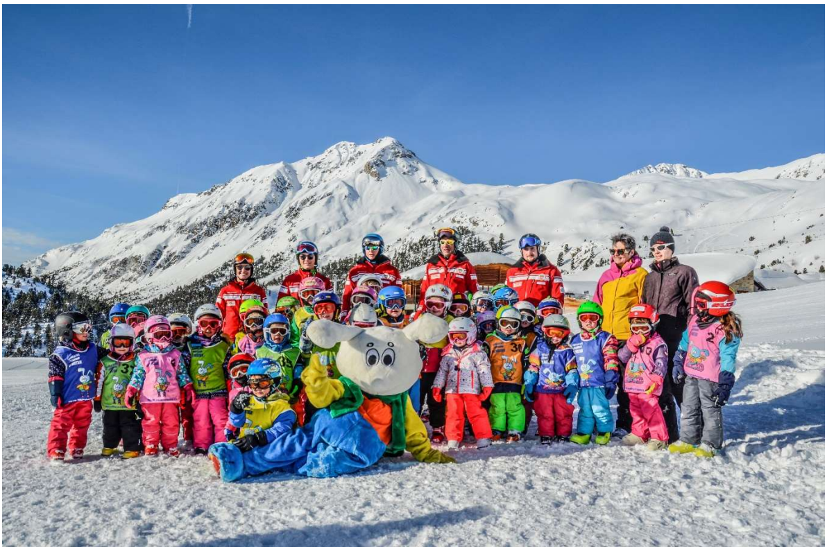
Ein hervorragendes Ergebnis erzielte die Ski- und Snowboardschule Val Müstair im vergangenen Winter trotz Corona bedingten Einschränkungen.