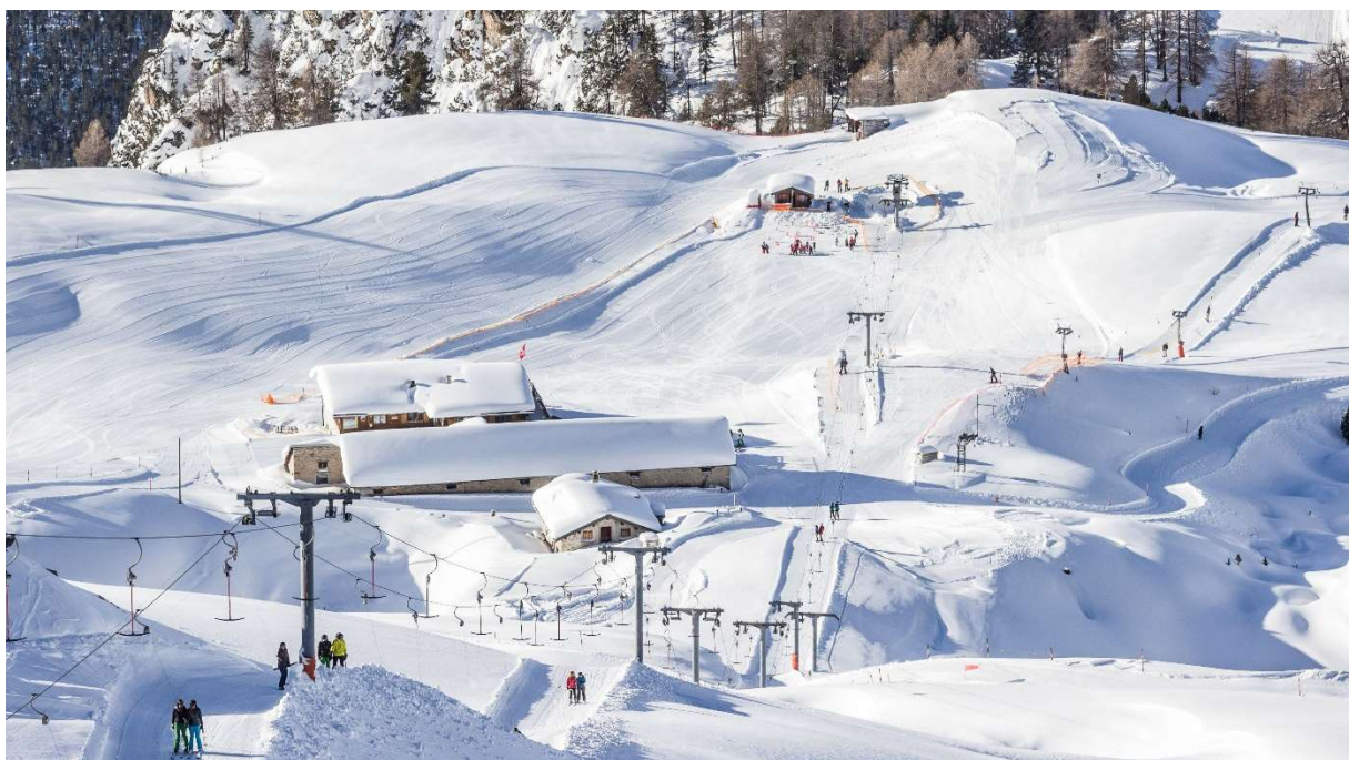
Alp da Munt auf 2'150 Meter über Meer ist das Zentrum der Wintersportaktivitäten am, um und auf dem Hausberg Minschuns (2'500 Meter über Meer).