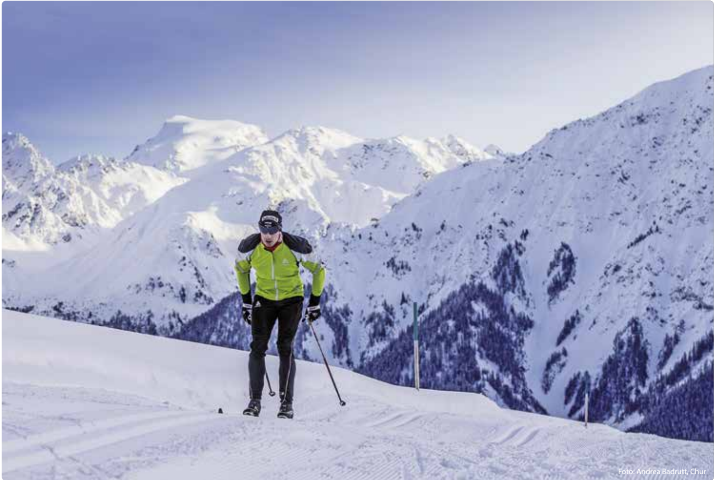
Die Langlauf Höhenloipe führt von Alp da Munt nach Plaun da l'Aua.