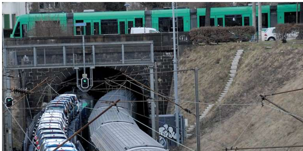
Der Schützenmatttunnel (RFC 2) muss auf P400 erweitert werden (Foto: Sylvain Meillasson).

09:15 Mehr Güter auf die Schiene mit dem 4-Meter-Korridor , Thomas Staffelbach , SBB Gesamtkoordinator Basel