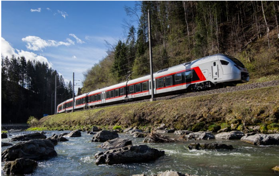
5: Zehn RAbe 526 «Flirt» der SOB sind bereits mit ATO-Rechnern ausgerüstet