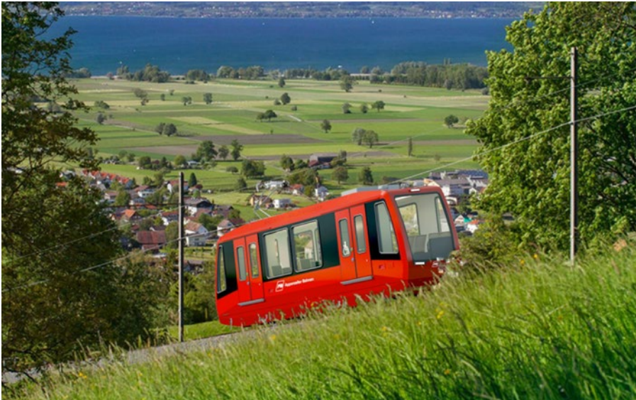
3: Die Rheineck–Walzenhausen Bahn wird im Jahr 2025 die erste nach GoA4 verkehrende Überlandbahn sein und dazu ein neues Fahrzeug erhalten

die Züge punktgenau anhalten. Automatisiertes Anhalten und Abfahren können den Lokführer dabei unterstützen. Mit dem Ausbau des netzweiten Halbstundentaktes auf den vorwiegend einspurigen Strecken wird die Fahrplangestaltung immer schwieriger. Ein gleichzeitiges Einfahren in den Bahnhöfen und Kreuzungsstellen ist heute nicht überall möglich. Daher braucht es für den effizienten Bahnbetrieb künftig mehr Automation zwischen Infrastruktur und Rollmaterial. Mit einem Tempomaten können die Fahrzeiten auf der Strecke optimiert und damit stabilisiert werden.